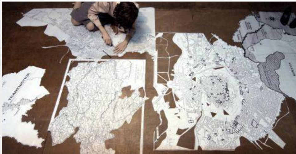
Maya Zack, Counterlight , 2016 – video still – Courtesy MLF – Marie-Laure Fleisch e l'artista

Terza personale italiana per Maya Zack (Tel Aviv, 1976). Vale la pena fare un salto. Fulcro della mostra, un video in cui la vita del poeta ebreo rumeno Paul Celan – capace di far cambiare opinione a Theodor Adorno in tema di poesia e Shoah – viene rincorsa dall'indagine d'archivio di una ricercatrice. Protagonisti il ritaglio e il disegno – ovvero la manualità, e con essa la carne –, per mezzo dei quali la fredda lontananza del documento di repertorio (scritto e fotografico) si ribalta via via in pulsazione concreta, parossismo chiarificatore. A incantare è la naturalezza con cui il girato evolve verso esiti metaforici e barocchi. Un lavoro solido e avvincente, che fa pensare a Hitchcock e a Matthew Barney, non solo a William Kentridge. Magistrale l'uso del crescendo musicale operistico. Altri lavori in mostra parlano del video – dei disegni di taglio illustrativo, più una bella scultura: un libro muto, spalancato quanto possono esserlo una fisarmonica o un polmone.