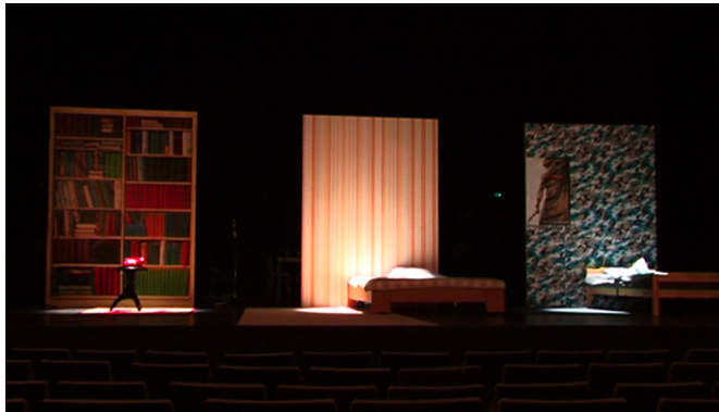
אסאמבלאז' חסר זהות קונקרטי. קרן ציטר, וידיאו דיגיטלי, 2009

רוזן צילם את עבודת הווידיאו "צחוקים" באולפן טלוויזיה כשהוא עושה שימוש בפורמט של מופע סטנד-אפ אמריקאי, ומראה כיצד הוא קורס לתוך עצמו דווקא בגלל תוכן הבדיחות. הפער בין הפורמט היהודי-ניו-יורקי, לצופים הישראליים שנראים בעבודה (בניהם אוצרות התערוכה ואמנים שונים) מחזק את תחושת הבגידה ב-"אחים". הבדיחות מצחיקות את הצופים הנראים בעבודה לסרוגין, אך גם מעוררות בהם אי נחת ועם הזמן הקהל מתחיל להזיע, כאילו הוא דוחה את התוכן מתוכו.