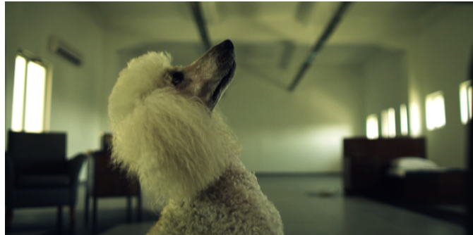
מבט מהוקצע ומורכב. חוק שחור לבן, מאיה ז"ק, וידיאו 2010

התערוכה "ניאו-ברברים" אם כן מכוונת להציג תזה ובסיס תיאורטי נרחב לענף מרכזי ומשמעותי שעולה בעשרות האחרונים בעולם האמנות בכלל, ובעשייה המקומית של העשור האחרון בפרט. ברוח זו, מרבית האמנים הניאו-ברברים בוחרים לנקוט ב"שיח בגידה". לא מעט אמנים בתערוכה זו בוחרים "לשדוד" פורמטים טלוויזיוניים, קולנועיים, לשוניים או תיאטרליים מוכרים ולחולל מתוכם אקט של התנגדות פאסיבית-אגרסיבית ולעיתים קרובות פשוט בגידה. במרבית העבודות שבתערוכה יש איזה תדר קומי שנועד להטיל ספק בלוגיקה של החשיבה המערבית המסורתית ולהציע מובלעות של אי-מובנות המבקשת להנציח עצמה כזכאת.